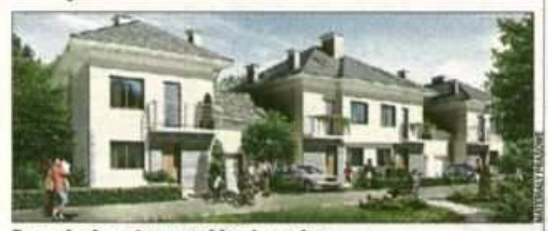
Domy będą gotowe pod koniec roku

Ronson Development wprowadza nową ofertę dla osób zainteresowanych nabyciem domu w projekcie Gardenia w podwarszawskim Józefosławiu. Ci, którzy do końca października zdecydują się na zakup domu w tej inwestycji, otrzymają w cenie domu także jego wykończenie.